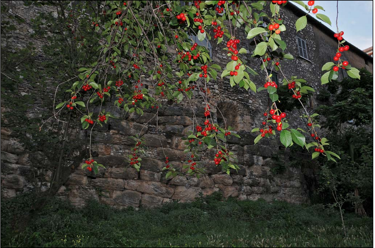
Mura poligonali del Palazzo Giorgi - Roffi Isabelli