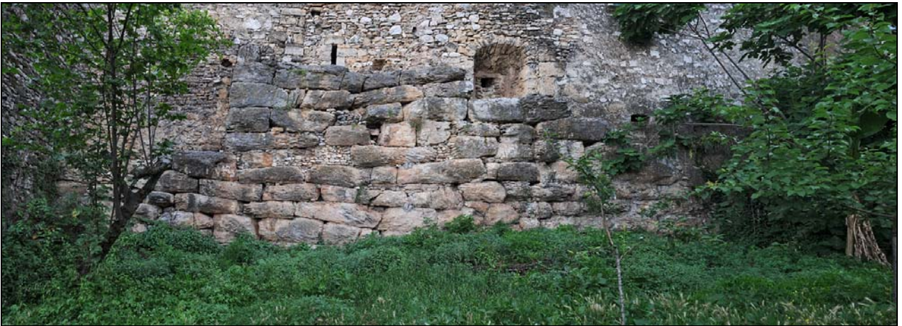
Mura poligonali del Palazzo Giorgi - Roffi Isabelli